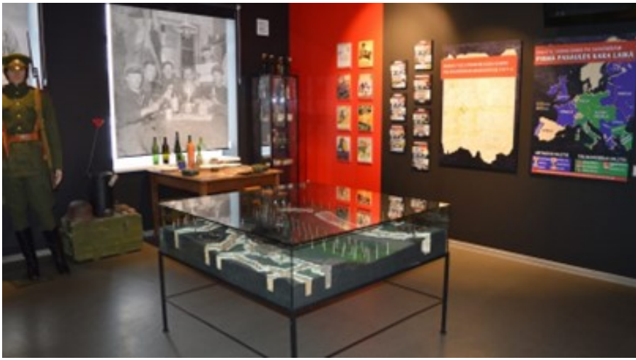
Bilde no 1. Pasaules kara muzeja Augšdaugavas novadā.

Projektā tika izveidota un popularizēta mobilā aplikācija, izveidota e-mārketiņa kampaņa, kā arī brošūras ar kartēm, kas izveidotas vairākās valodās (LT, LV, RUS, ENG, GER un PL). Saistībā ar to, ka maršruts ticis pozicionēts kā bezauto maršruts, apmeklētājiem iegādāti 20 velosipēdi (10 no katras puses), kā arī katrā izstāžu centrā ir 5 elektrovelosipēdi, kas piemēroti cilvēkiem ar dažādu fizisko stāvokli. Izstāde, kas ir 113 kv.m. liela, sastāv no diviem tematiskiem blokiem. Pirmā daļa veltīta Pirmā pasaules kara notikumiem Eiropā un Latvijā, bet otrajā daļā apmeklētājiem ir iespēja iejusties karavīra lomā, pašiem izjust bunkura ikdienu. Apmeklētājiem būs iespēja iejusties kaujas lauka gaisotnē, kā arī skolas vecuma bērni izstādes apmeklējumu var izmantot kā vēstures stundās apgūtā atkārtojumu!