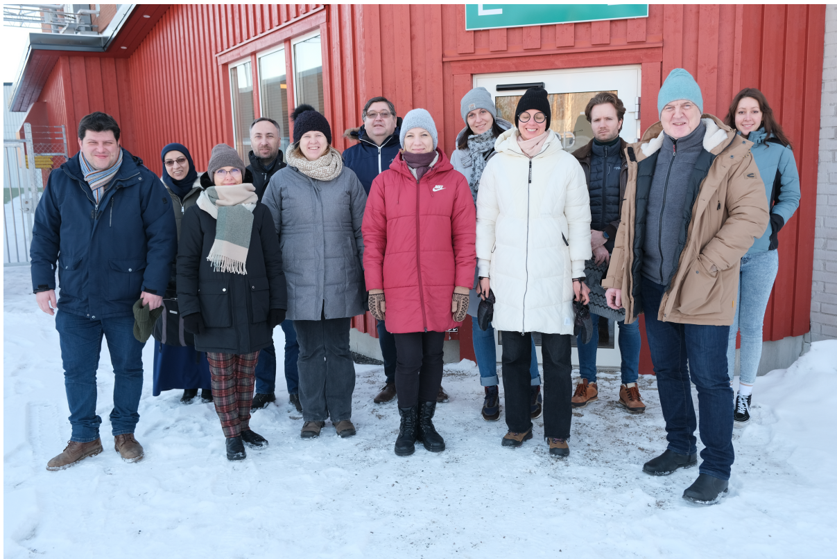
Projekta nosaukums: EXPLORING FULL CYCLE CIRCULAR ECONOMY FOR GLASS FIBER INDUSTRY (Pilnas aprites ekonomikas izpēte stikla šķiedras industrijā) “GlassCircle”