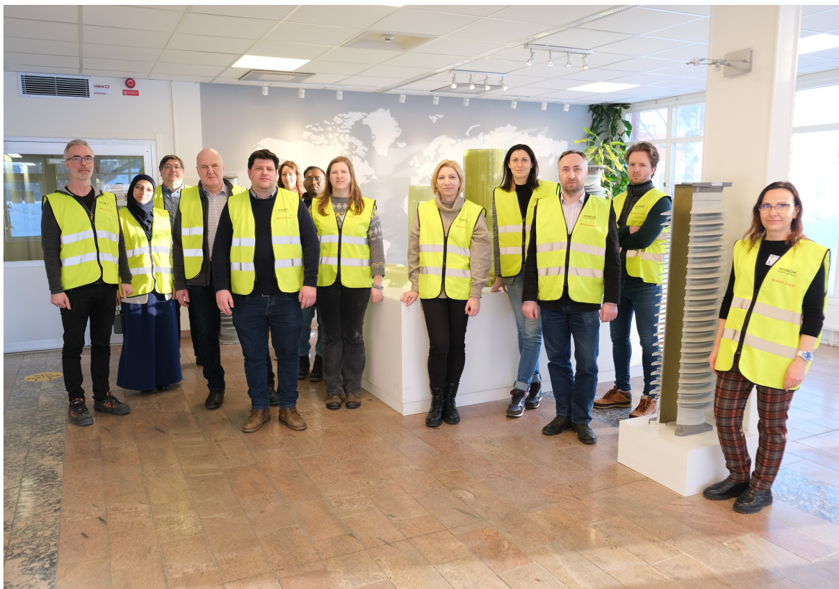
Informāciju sagatavoja: Līva Pupure